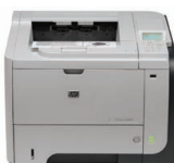
Stampante HP LaserJet Enterprise P3015d